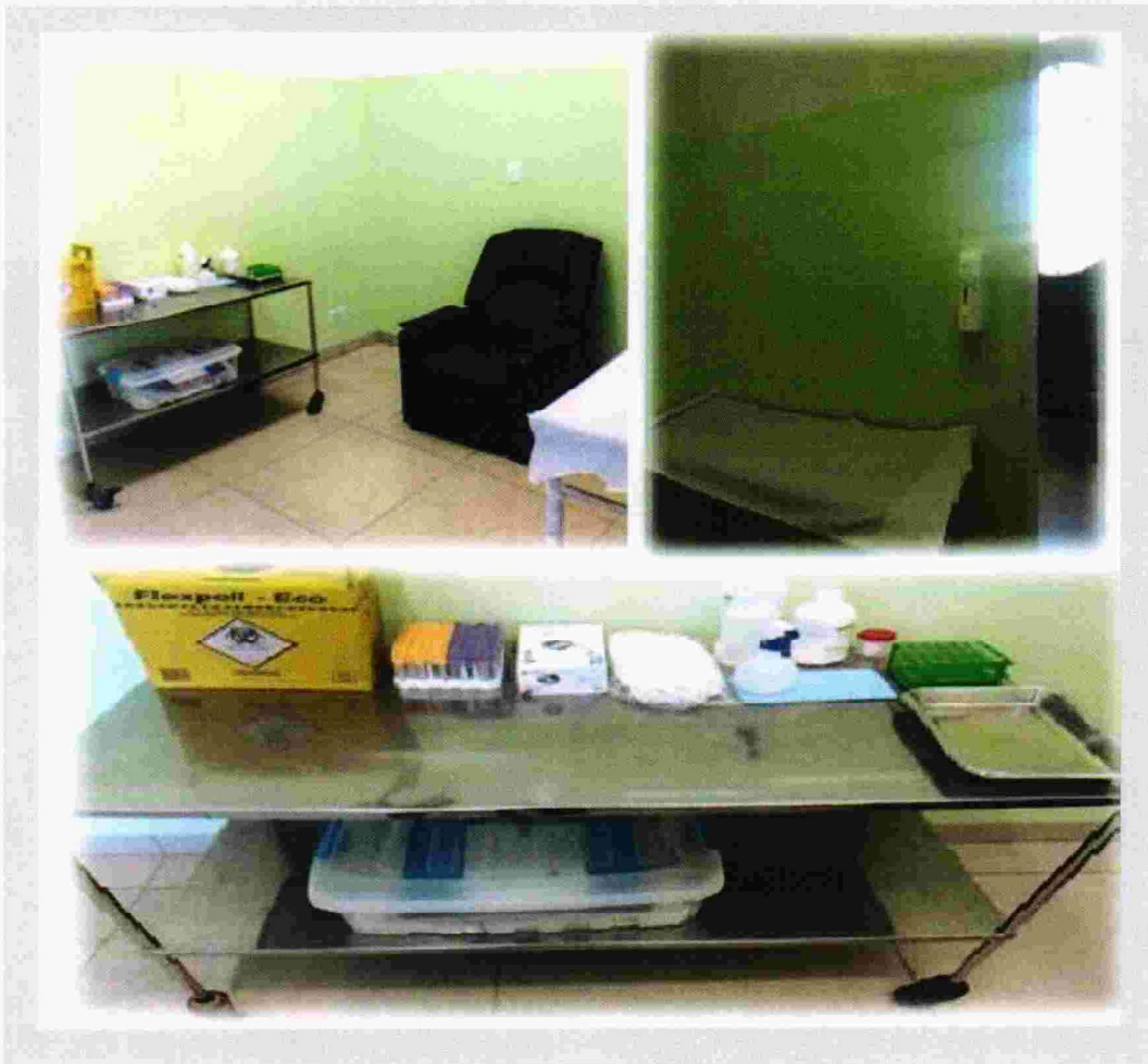
Figura 4: SALA PARA COLETA DE SWAB: SALA PARA COLETA DE MATERIAL BIOLÓGICO E SWAB PARA TESTE DA COVID-19.