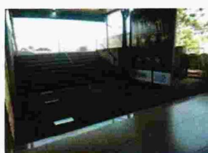
ENTRADA PARTE INTERNA