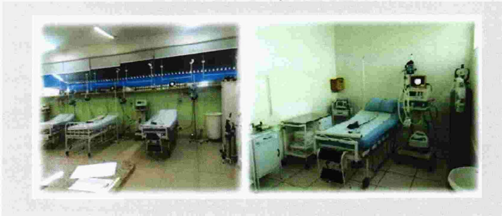
Figura 3: LEITO AVANÇADO DE ISOLAMENTO: RESPIRADOR, MONITOR, CARRINHO DE URGÊNCIA, MATERIAL DE ENTUBAÇÃO, SALA EQUIPADA ADEQUADAMENTE PARA ATENDIMENTO DE SINTOMAS RESPIRATÓRIOS

Figura 2 SALA VERMELHA: 03 LEITOS FIXOS COM 2 RESPIRADORES E ADEQUADO 01 LEITO DE ISOLAMENTO COM SUPORTE AVANÇADO 01 RESPIRADOR TODOS EQUIPAMENTOS EM PERFEITAS CONDIÇÕES DE USO.