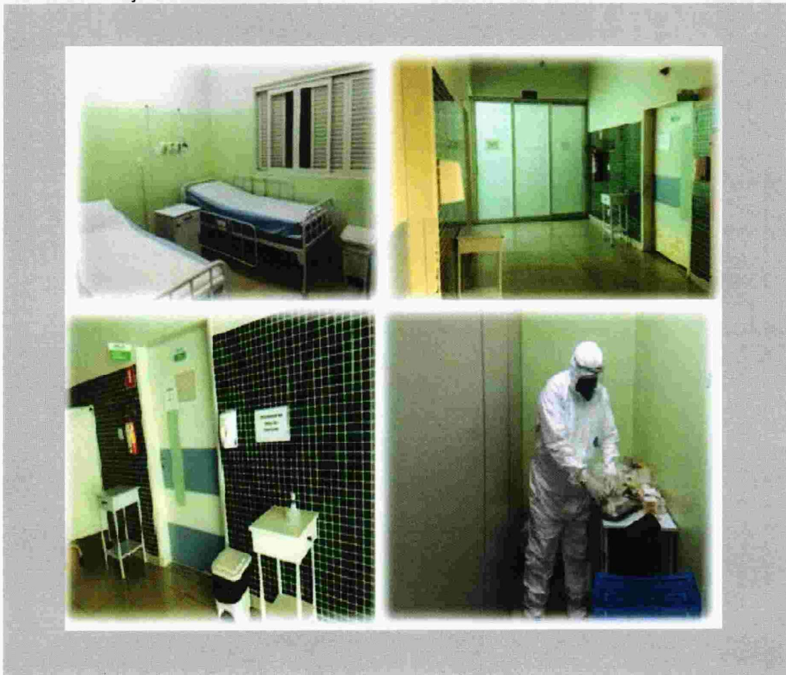
Figura 5: ISOLAMENTO SEMI-CRITICO: SÃO DOIS ISOLAMENTOS COM 2 LEITOS CADA ADEQUADO PARA NECESSIDADE DE SUPLEMENTAÇÃO DE OXIGENIO.