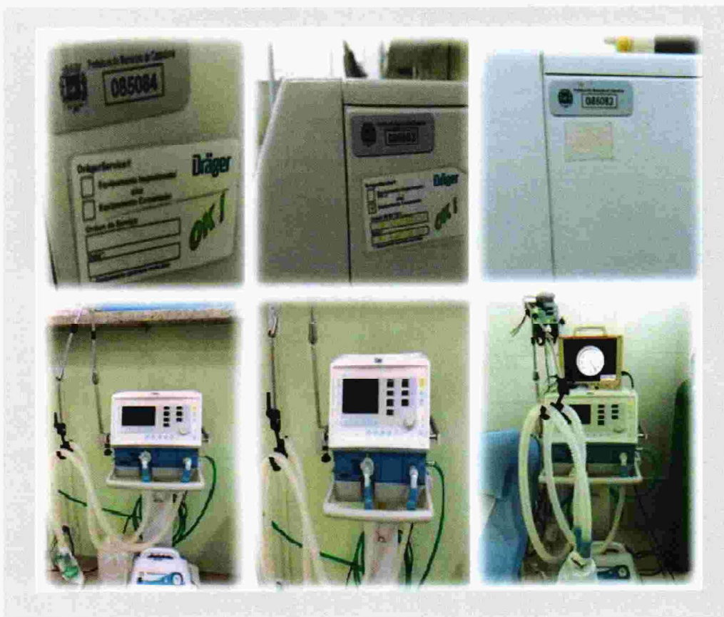
Figura 1: TRÊS RESPIRADORES DA SALA VERMELHA