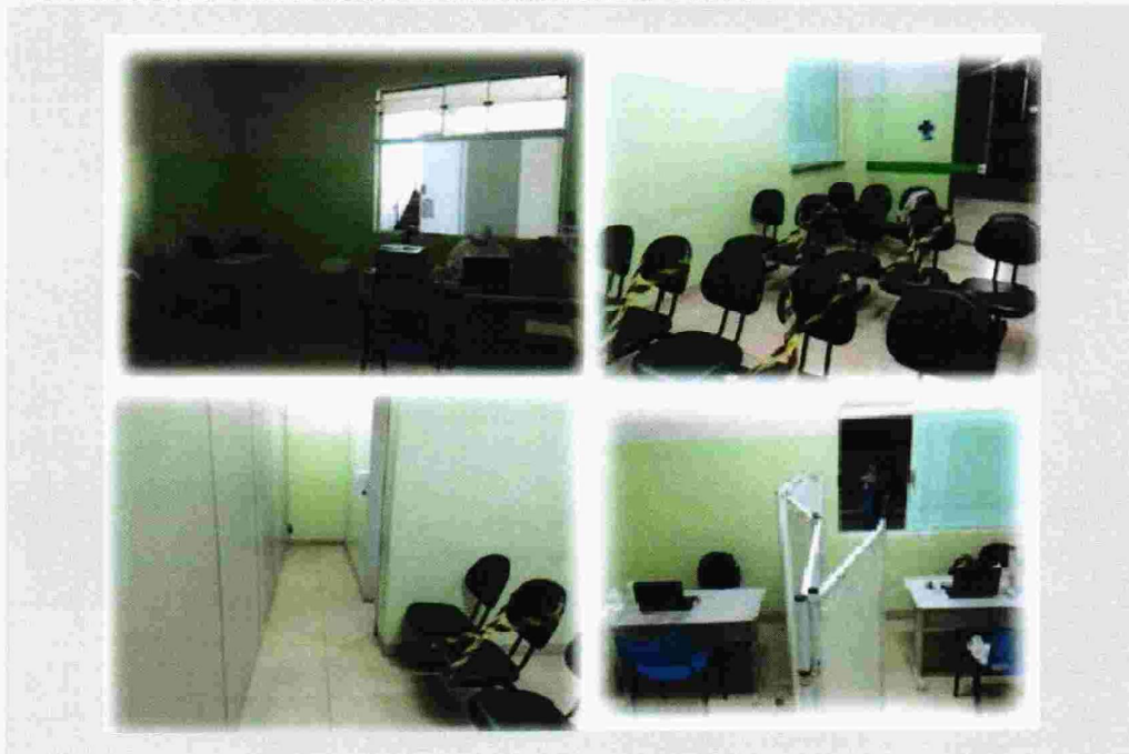
Figura 8: SETOR PARA ATENDIMENTO DE SINTOMAS GRIPAIS: FOI ADEQUADO SETOR COM ISOLAMENTO DO FLUXO COMUM DA UNIDADE PARA ATENDIMENTO DOS PACIENTES COM SINTOMAS GRIPAIS.