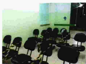
SALA DE ESPERA PARA CONSULTA