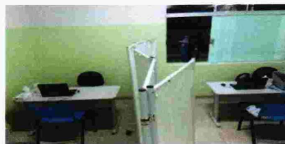
CONSULTÓRIOS PEDIATRIA E CLINICA

ABRIL/2021: TOTAL DE 1911 ATENDIMENTOS COM CID= J11 (INFLUENZA) E/OU CORONA VIRUS POSITIVO, EXCLUINDO DIAGNÓSTICOS DIVERSOS QUE NÃO CARACTERIZAM SINDROME GRIPAL, EX: AMIGDALITE, IVAS...etc.